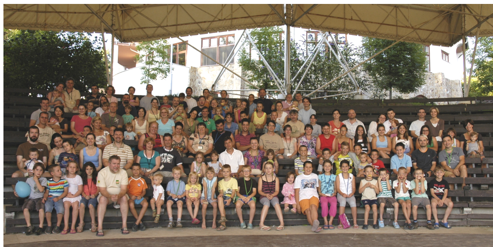
Családos hét - Balatonszárszó