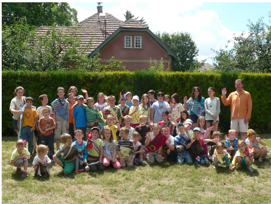
A hittantábor világjárói