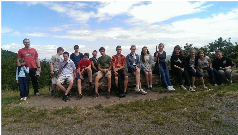
Pénteki IFI szirtmászás közben