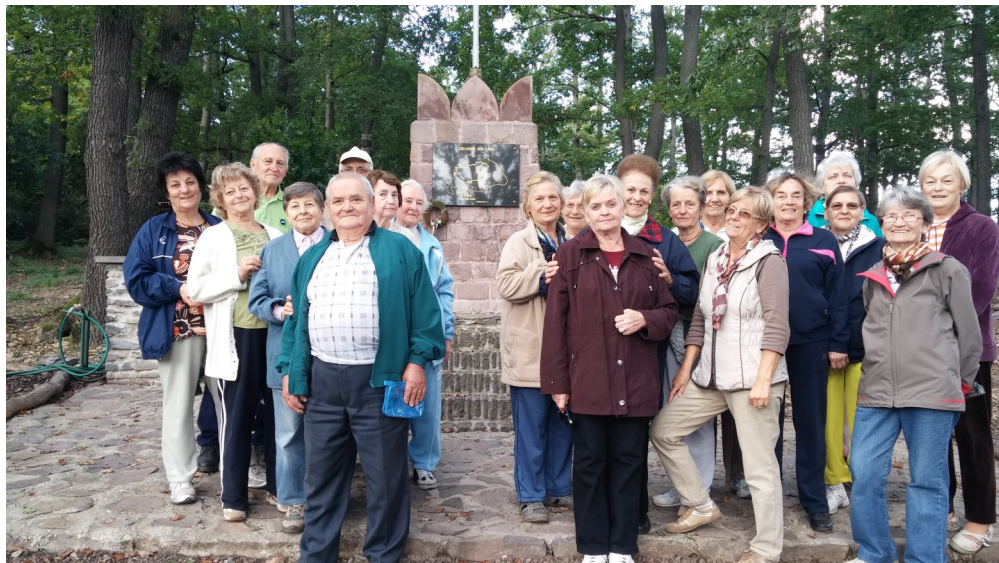
Kiránduló csapat az őszi gyülekezeti csendeshéten