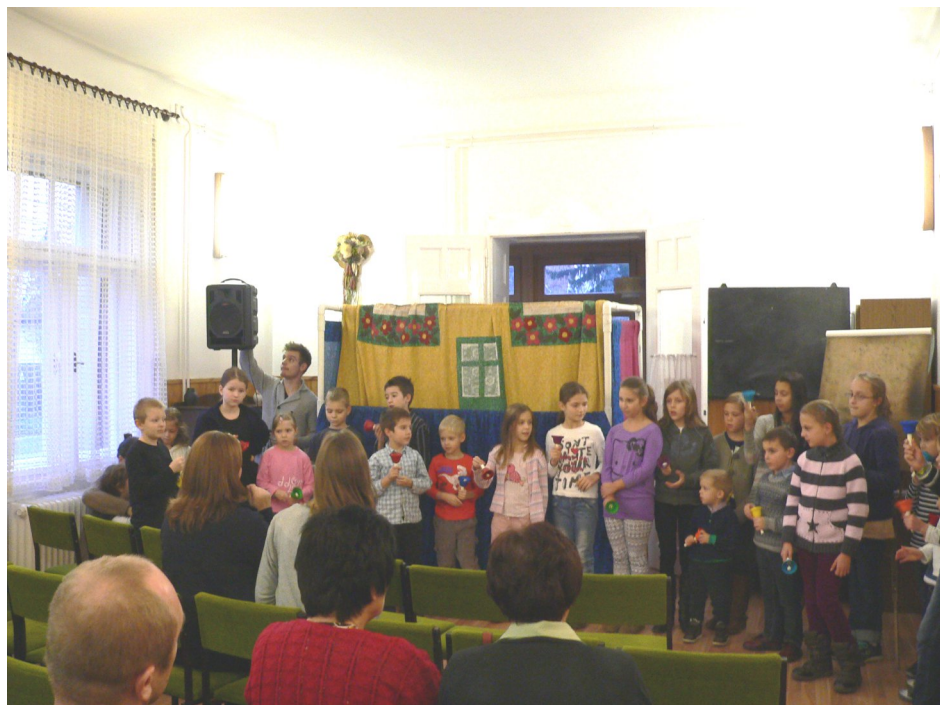
Az adventi délután alkalmi harangkórusa