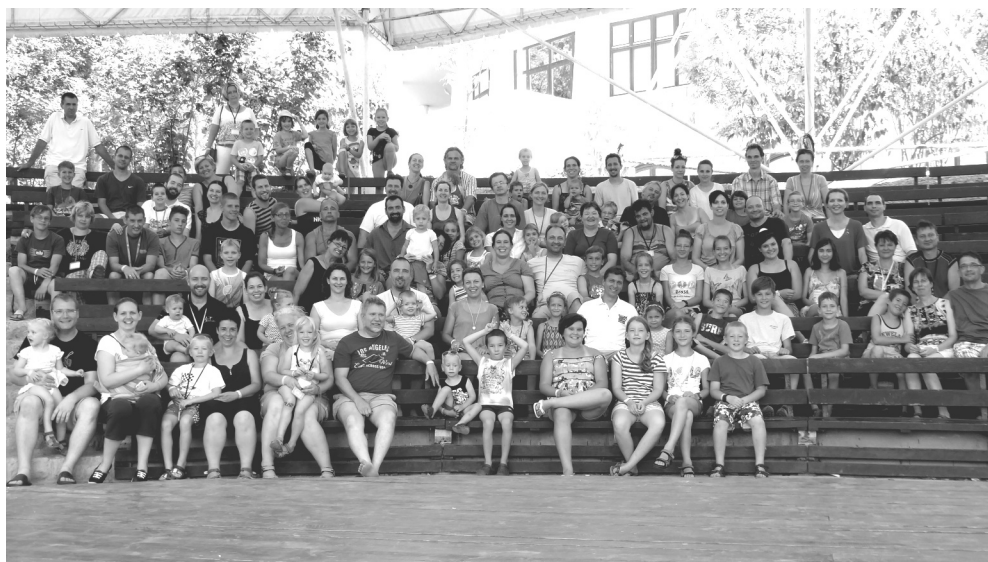
Balatonszárszó - családi csendeshét