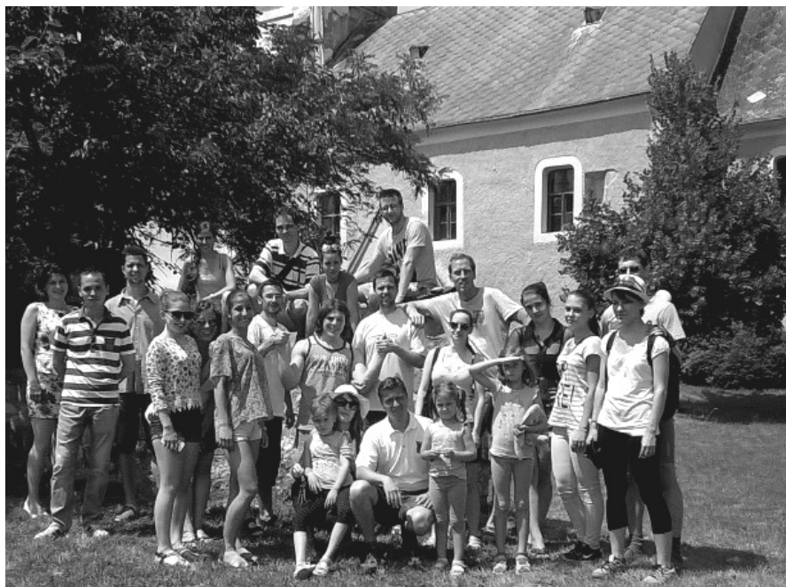
Monoszló - szombati ifjúsági csoport