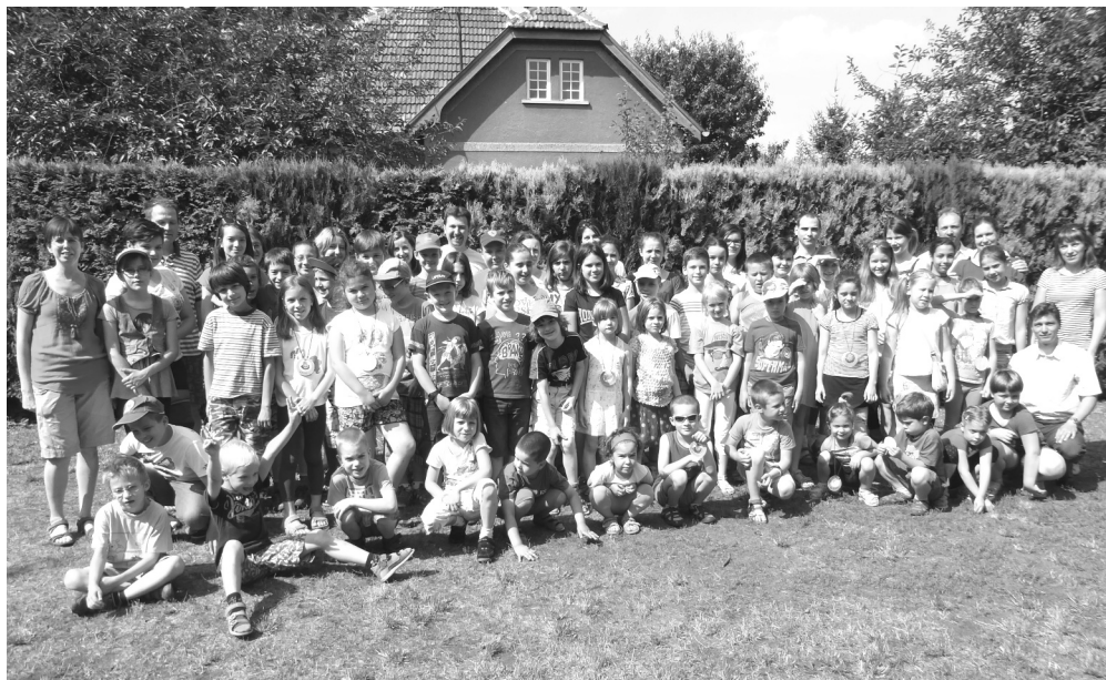
A 2015-ös hittantábor résztvevői