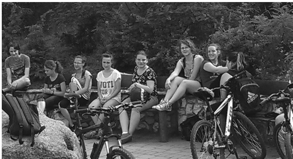
Gárdony - pénteki ifjúsági csoport