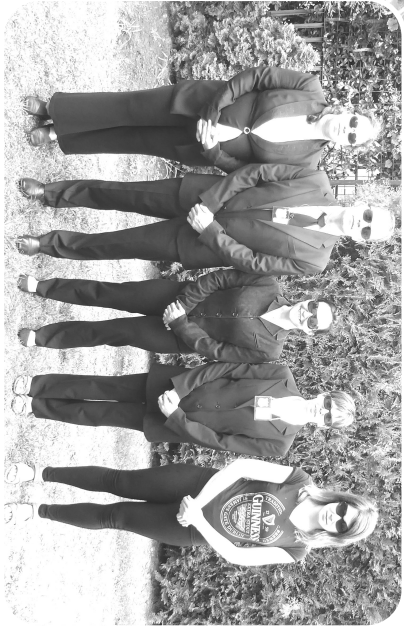
Közös éneklés a templomban - a kis képen néhány "kiképző" tiszt látható