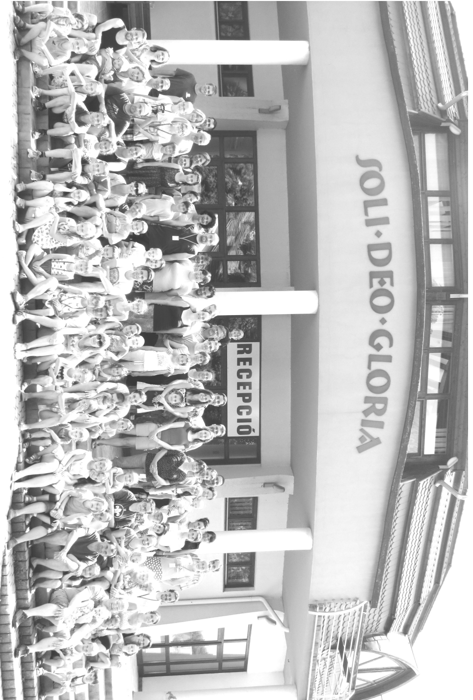
Szárszói csendeshét résztvevői