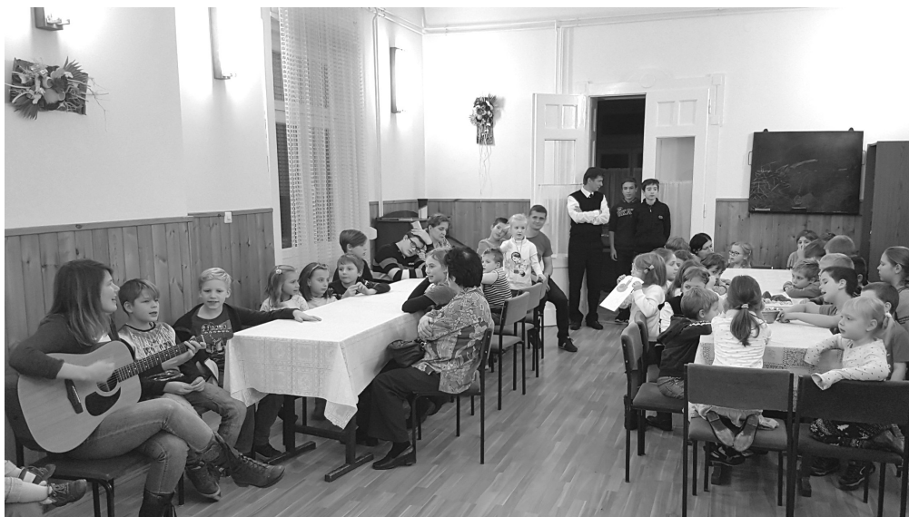
Hittanos gyerekek adventi délutánja